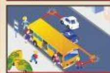
Переходя дорогу всегда как пешеход, всегда, там впереди.