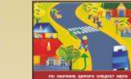
По дороге следует идти только по пешеходному переходу.