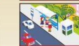
На пешеходном переходе всегда соблюдайте правила дорожного движения.