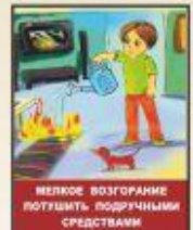
Мелкое возгорание потушить подручными средствами