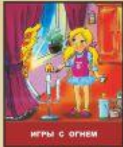
ИГРЫ С ОГНЕМ