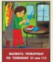
ВЫЗВАТЬ ПОЖАРНЫХ ПО ТЕЛЕФОНУ ОТ НОМ. 112