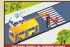
Переходя дорогу на пешеходном переходе, всегда следите за движением транспорта.