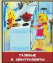
ГАЗОВЫЕ И ЭЛЕКТРОПЛИТЫ