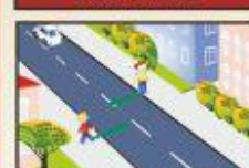
Обеспечивайте пешеходный переход, дорогу разрешается переходить там, где она обозначена в обе стороны.