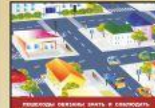
Проверяйте, чтобы вы знали, в каком направлении движется транспорт.