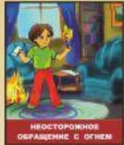
НЕОСТОРОЖНОЕ ОБРАЩЕНИЕ С ОГНЕМ