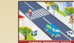
Всегда соблюдайте правила дорожного движения.