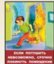
Если потушить невозможно, срочно покинуть помещение